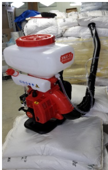
Aperçu de notre outillage

Enregistré comme additif pour l'alimentation humaine E551 dans le «Codex Alimentarius»